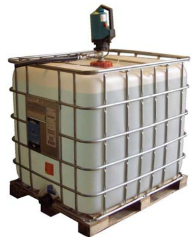
IBC med pump