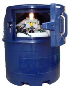
Distributionsenhet 3 000 - 10 000 liter