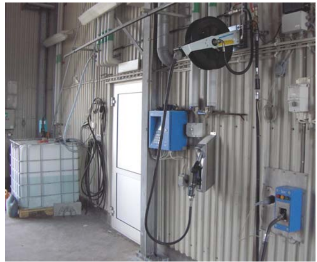
Exempel på en installation av tankningsutrustning för AdBlue® och diesel i en mindre fordonsdepå.

AdBlue® har speciella egenskaper som måste beaktas när man hanterar vätskan och utformar förvarings- och påfyllningssystem. Vätskan kristalliseras vid kontakt med luft och orsakar korrosion varför rätt materialval är viktigt. IDENTICs lösningar för distribution av AdBlue® är anpassade för de specifika egenskaper som AdBlue® har.