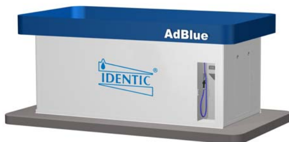
Moduluppbyggt stationssystem 3 000 - 36 000 liter