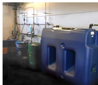
Inomhus förvaringssystem 3 000 - 18 000 liter

För åkerier med egna depåer och en större mängd SCR-utrustade fordon blir det mer kostnadseffektivt att ha en permanent tankanläggning som kan fyllas på med tankbil. IDENTIC har färdiga koncept även för detta och kan erbjuda skräddarsydda lösningar.